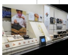
玉佩・玉佩篋 (ぎよくはい・ぎよくはいばこ)