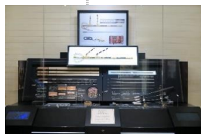
玉纏御太刀 (たままきのおんたち)